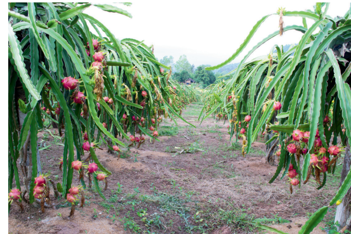
DRAGON FRUIT FARMING