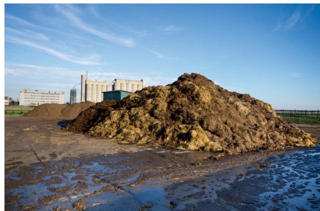
COW DUNG FERTILIZER